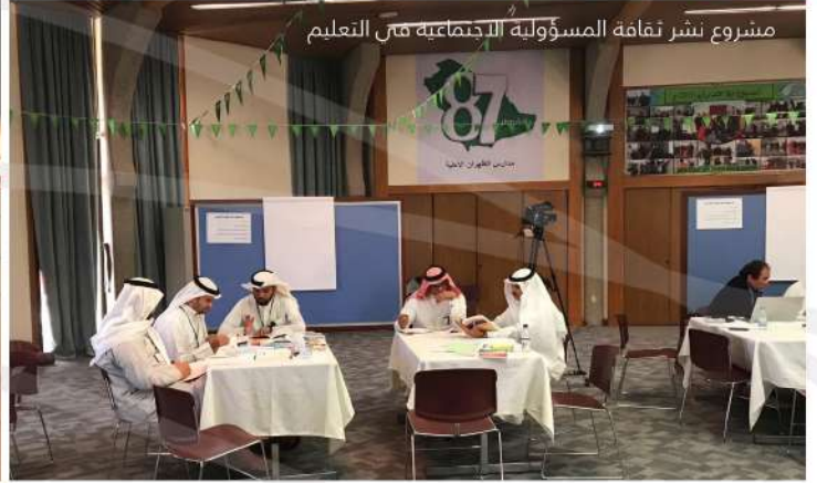
مشروع نشر ثقافة المسؤولية الاجتماعية في التعليم