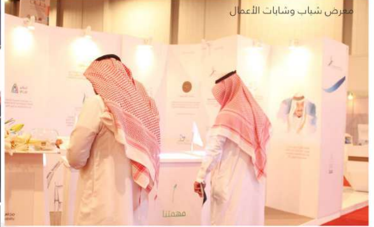
معرض شباب وشابات الأعمال