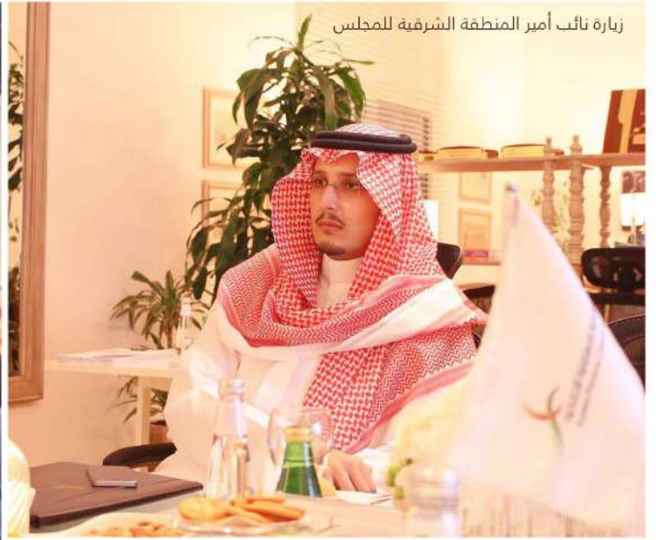
زيارة نائب أمير المنطقة الشرقية للمجلس