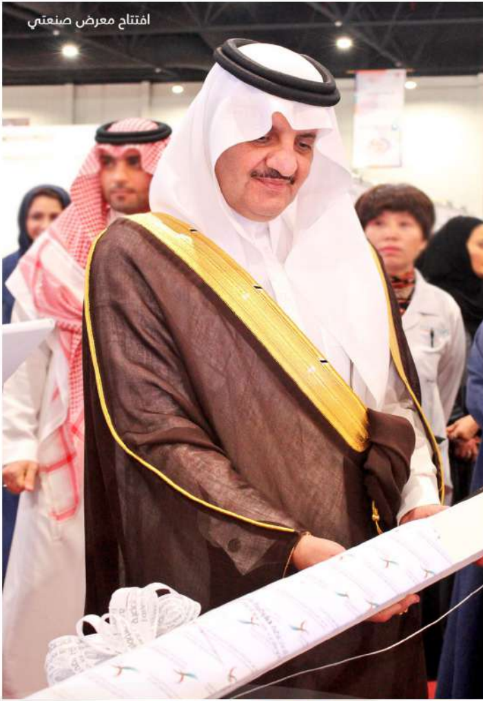
افتتاح معرض صنعتي